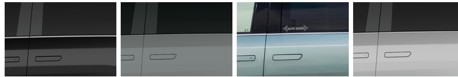
לבן פנינה | ירוק איזמרגד | צביעה דו גונית - אפור בטון וגג שחור (בתוספת תשלום) | שחור מטאלי