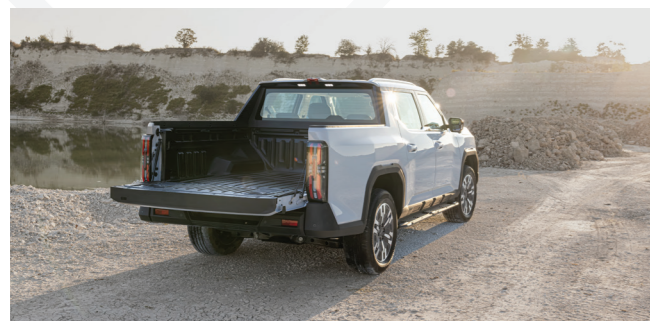
ארגז אחורי מרווח עם פתיחה חשמלית מהשלט, כיסוי מובנה ומד שקילה דיגיטלי עם תצוגה במערכת המולטימדיה