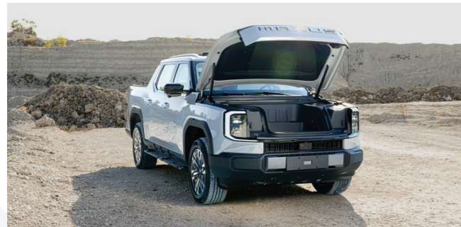
תא מטען קדמי רב-תכליתי בנפח 236 ליטרים, כושר העמסה של 75 ק"ג, עם אפשרות שליטה בזווית הפתיחה